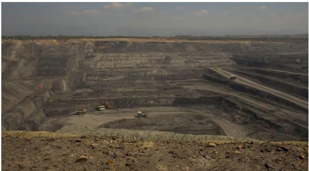
2019 年，位于哥伦比亚瓜希拉省 (La Guajira) 巴兰卡斯 (Barrancas) 的塞雷洪煤矿。

这些对健康的影响如此严重，甚至被刻入当地人的基因中。2018 年的一项研究发现，塞雷洪造成的污染正在从细胞层面损害当地人，增加了患癌症和染色体不稳定的风险 23 。