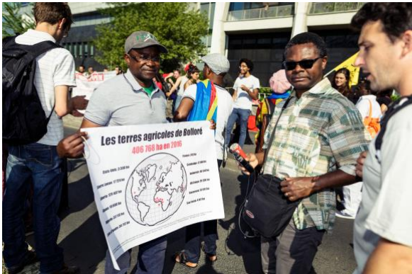
2017 年 6 月 1 日，法国巴黎。数十名活动人士聚集在博洛雷总部外，抗议几个非洲国家对工业种植园的不负责任的剥削。

喀麦隆的一些团体和国际非政府组织也试图在法国提起诉讼。2019 年，他们试图起诉博洛雷违反 2013 年达成的一项协议，该协议旨在改善法国 Socfin 在当地的子公司 Socapalm 棕榈油种植园周边的工作和生活条件 136 。此前，该公司曾在 2010 年被投诉到经合组织，列出了该公司造成的损害，包括污染当地水源、阻止社区获取他们的作物，以及被该公司工作的安保人员实施了身体虐待 137 。