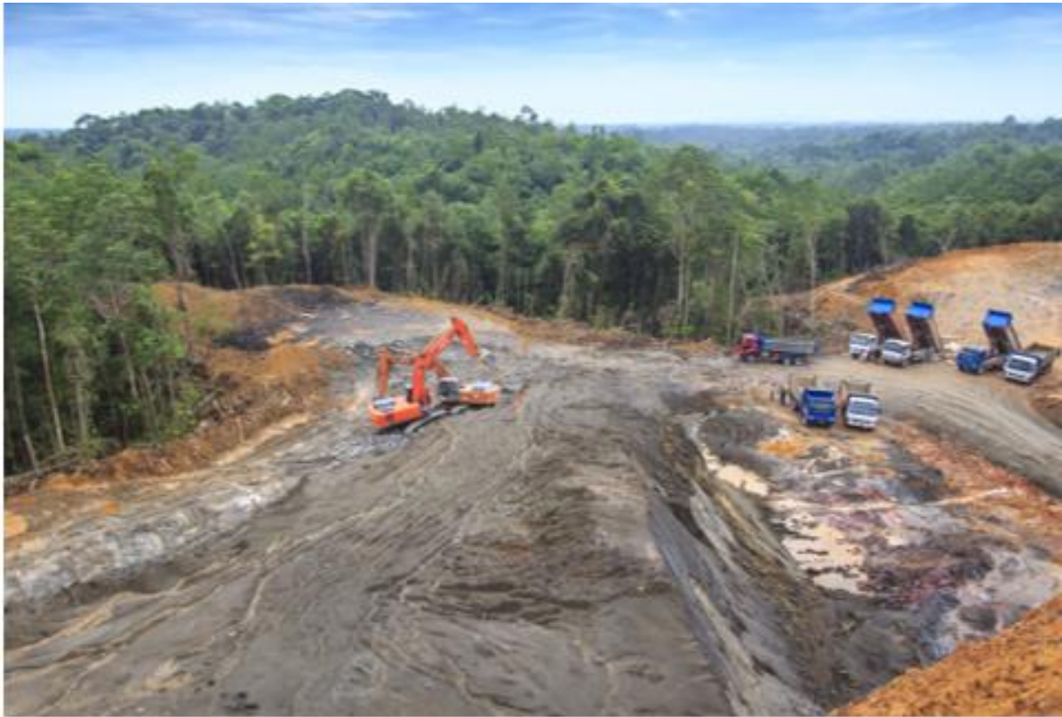
马来西亚古晋(Kuching)-2015年5月16日。毁林。为种植油棕榈,摧毁婆罗洲(Borneo)热带雨林的图片。

在新的欧盟指令中,应将反腐败的预防措施纳入企业的尽职调查职责 99 。为此,应在上述现有文书的基础上制订适用的标准。然而,这必须